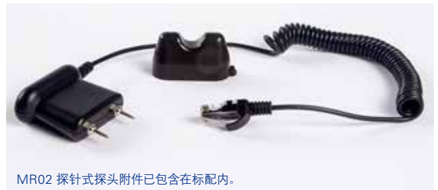
MR02 探针式探头附件已包含在标配内。

PORTLAND Corporate Headquarters FLIR Systems, Inc. 27700 SW Parkway Ave. Wilsonville, OR 97070 USA PH: +1 866.477.3687