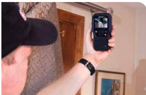
FLIR MR160正在探测天花板和墙角缝隙的受潮情况