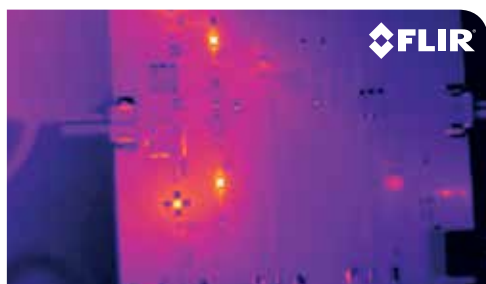
Wärmebild ohne MSX