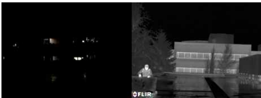
Visione a occhio nudo