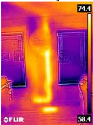
Tubo de drenaje caliente en la pared