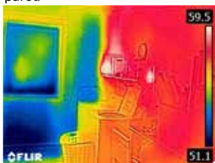
Pared exterior sin aislar