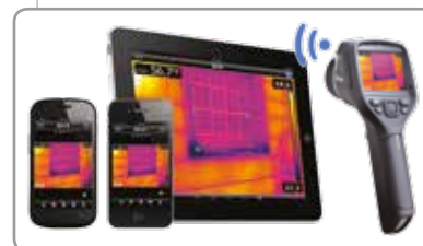
Connettività Wi-Fi FLIR Tools Mobile