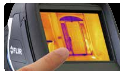
Ampio touch screen da 3,5"