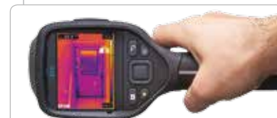
Orientamento automatico che mantiene i valori diagnostici in sovrapposizione orientati correttamente