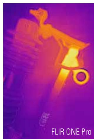
FLIR ONE Pro

FLIR Portland Corporate Headquarters Flir Systems, Inc. 27700 SW Parkway Ave. Wilsonville, OR 97070 USA PH: +1 886.477.3687