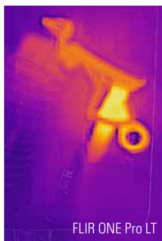
FLIR ONE Pro LT