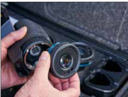
得益于AutoCal™光学部件,该热像仪可与各系列热像仪共用镜头(从广角到长焦镜头)