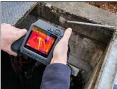
其分辨率高达161,472像素,可测得远距离目标的精确读数